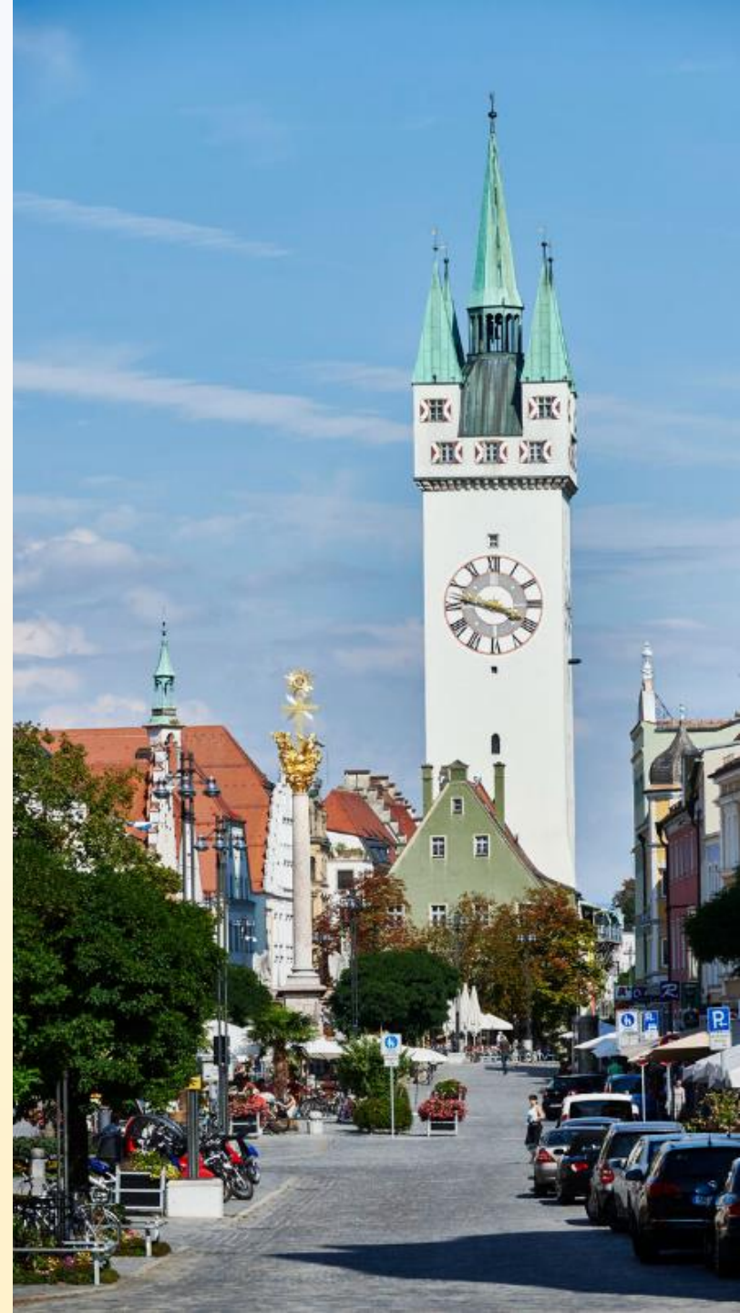
Bild: Straubinger Stadtplatz

Adresse: Stadtgraben 115 94315 Straubing